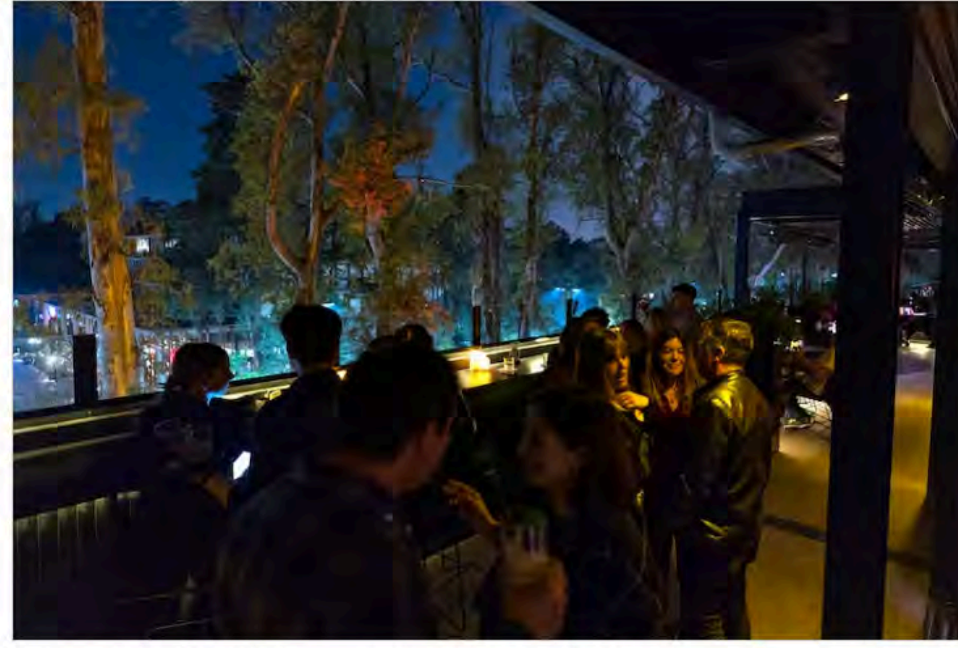
La terraza del bar Nob3l ofrece una gran vista del entorno arbolado