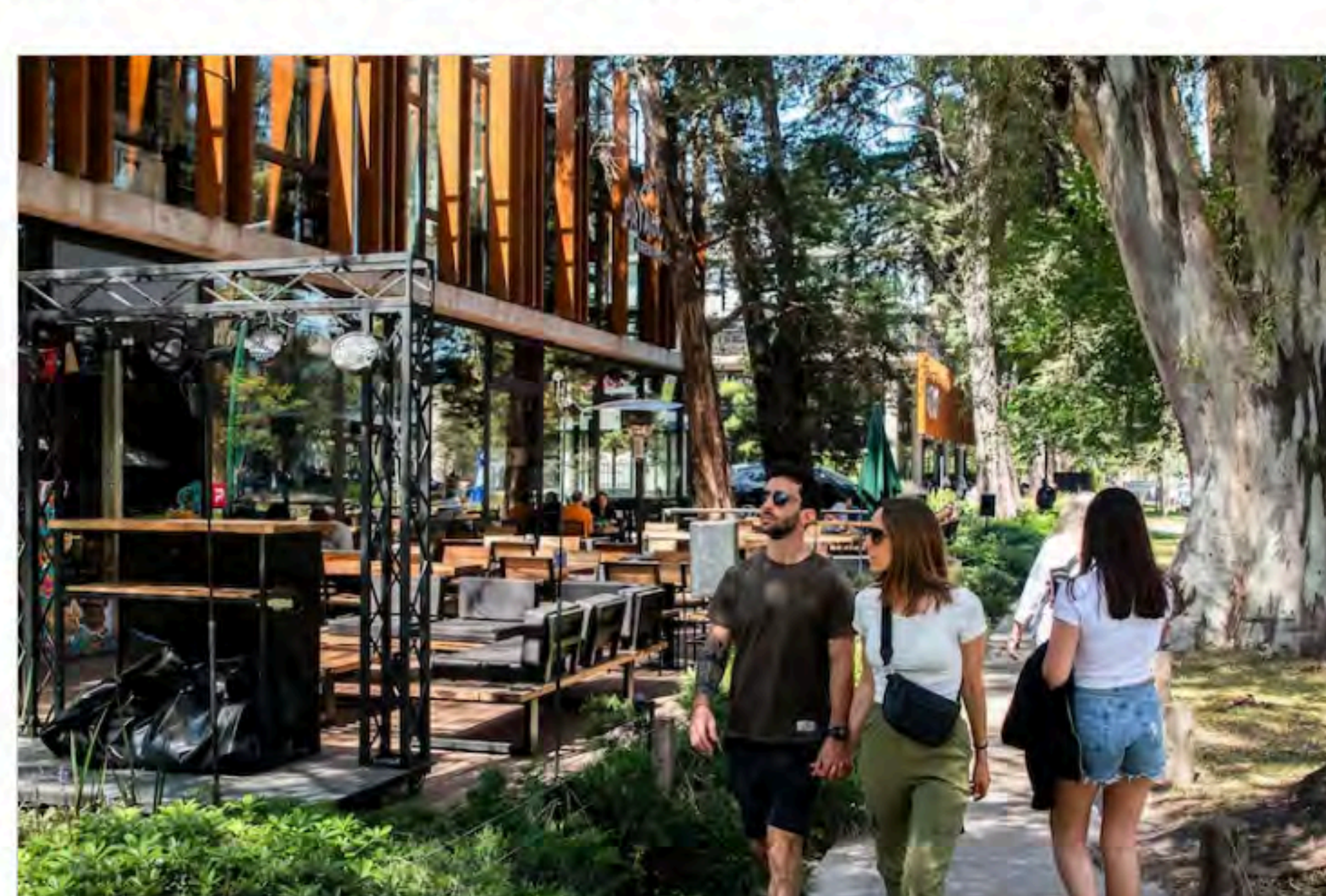
En Parque Leloir se respira un aire desconstruido, ideal para el relax

Sus 600 hectáreas han sido declaradas Área Ecológicamente Protegida por el municipio de Ituzaingó, por lo que cuenta con guardaparques que cuidan la flora y la fauna, e incluso con una entidad integrada por vecinos (Parque Leloir Asociación Civil), que busca preservar el entorno natural. Parque Leloir, su bosque y sus calles con numerosas curvas y rotondas, son obra del arquitecto, urbanista y paisajista francés Carlos Thays (que como Director de Paseos de la ciudad de Buenos Aires estuvo detrás del diseño del Jardín Botánico o el Parque Centenario, entre otros 67 paseos y plazas). Fue la familia Leloir, propietaria de la estancia que ocupaba lo que es hoy Parque Leloir, la que encargó el diseño de su parque y bosque a Thays.