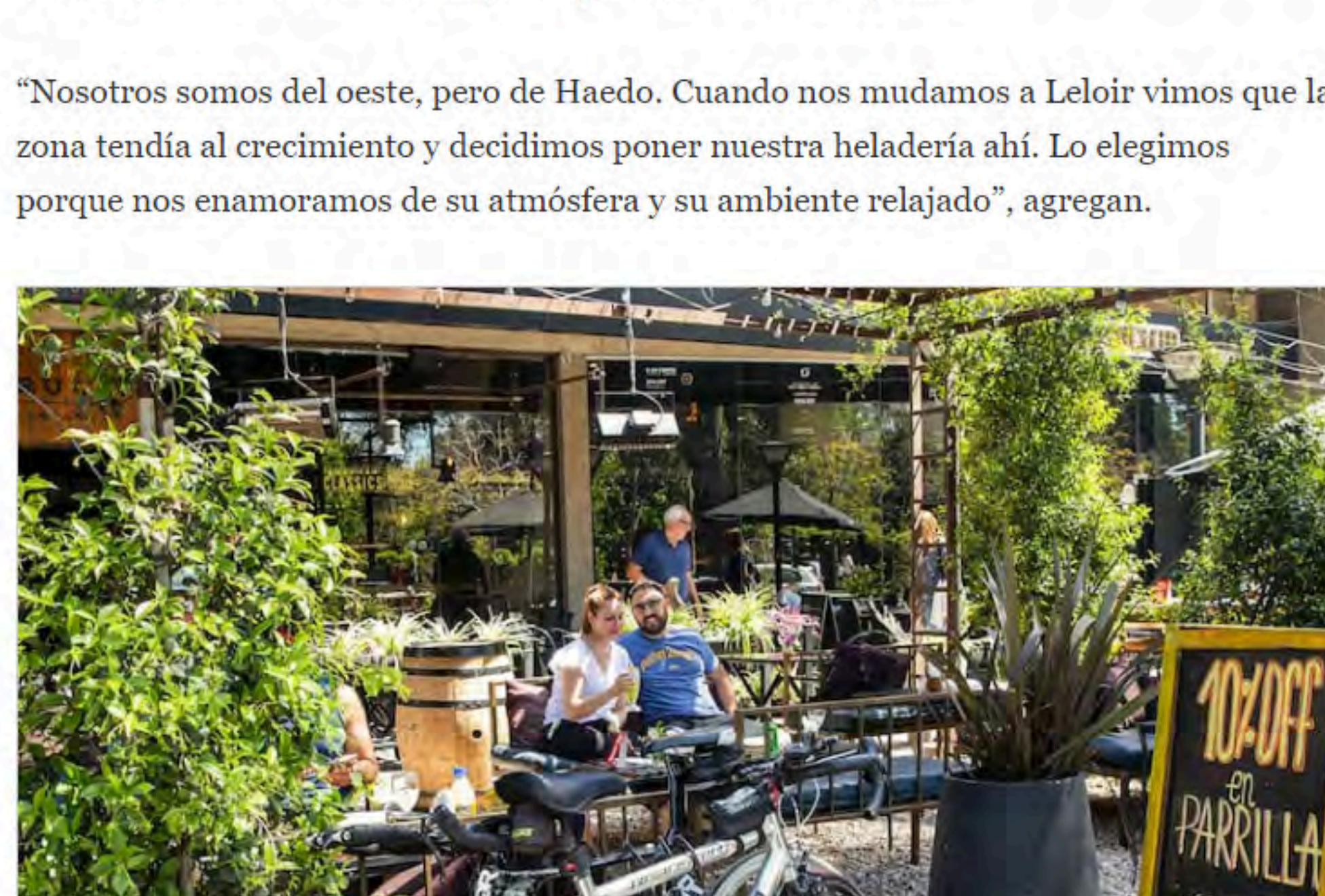
Polo gastronómico de Parque Leloir

"Nosotros somos del oeste, pero de Haedo. Cuando nos mudamos a Leloir vimos que la zona tenía al crecimiento y decidimos poner nuestra heladería ahí. Lo elegimos porque nos enamoramos de su atmósfera y su ambiente relajado", agregan.