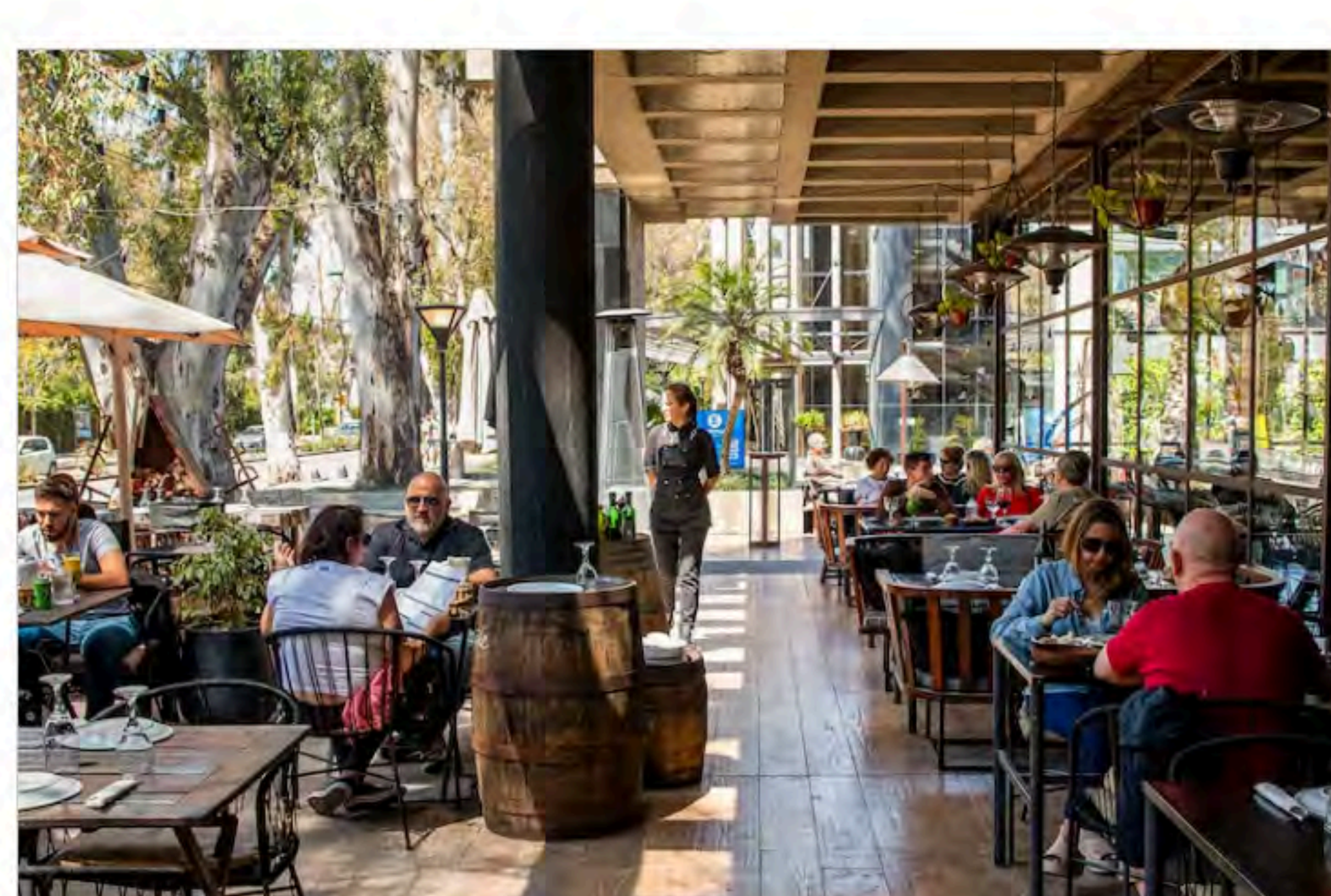
Es muy diversa la propuesta gastronómica de Parque Leloir